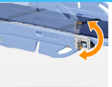
Swip Mechanism Sideboard