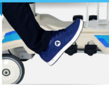
TR / ATR